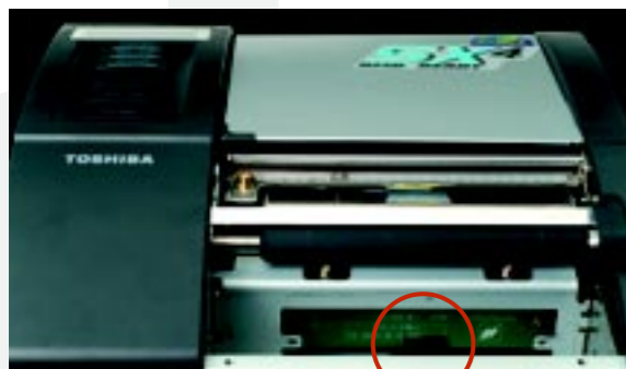
▲ UHF RFID Antenne